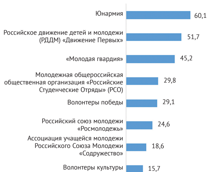
Рис. 3. Распределение ответов респондентов на вопрос: «Какие молодежные организации вам известны?», в % (можно выбрать любое количество вариантов ответа)*

Около трети опрошенных информированы о существовании Молодежной общероссийской общественной организации «Российские студенческие отряды» (РСО) (29,8%) и Всероссийское общественное движение «Волонтеры Победы» (29,1%). Менее пятой части респондентов (18,6%) имеют сведения об Ассоциации учащейся молодежи Российского Союза Молодежи «Содружество». И только каждый шестой — об общественном движении «Волонтеры культуры». Низкие показатели «Волонтеров культуры» (15,7%) и «Содружества» (18,6%) указывают на ограниченность целевой аудитории, слабую информационную поддержку и отсутствие массовых кампаний (рис. 3).