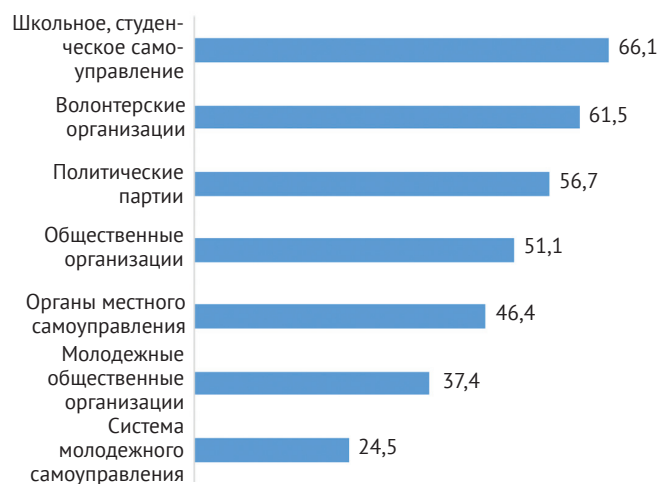
Рис. 2. Распределение ответов респондентов на вопрос: «Какие способы участия молодежи в общественно-политической жизни вы знаете?», в % (можно выбрать любое количество вариантов ответа)*

Парадоксально, но специализированные молодежные структуры (самоуправление — 24,5%, организации — 37,4%) менее известны, чем «взрослые» аналоги, что может объясняться слабой информационной работой, формальным характером многих молодежных структур, несоответствием их деятельности реальным потребностям и запросам молодежи. Относительно низкая осведомленность об органах местного самоуправления (46,4%) отражает слабую связь между молодежью и местной властью, недостаток понятных механизмов участия и дефицит успешных кейсов молодежного участия на местном уровне (рис. 2).