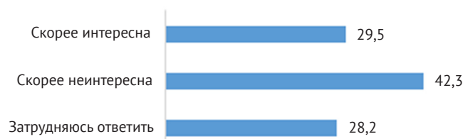
Рис. 1. Распределение ответов респондентов на вопрос: «Интересна ли вам деятельность отечественных молодежных общественных организаций?», в % от общего числа респондентов

Исследование выявило возрастную динамику в интересе к деятельности молодежных общественных организаций. С увеличением возраста интерес возрастает (от 24,1% среди людей младше 18 лет до 57,9% среди людей старше 25 лет). Также существуют и гендерные различия. Респонденты женского пола проявляют больший интерес к деятельности молодежных общественных организаций (40,8%), чем респонденты мужского пола (24,1%). Образовательный фактор также оказывает влияние на заинтересованность деятельностью молодежных организаций. По мере возрастания уровня образования увеличивается и интерес к деятельности общественных организаций. Наибольший интерес демонстрируют респонденты с высшим (52,9%) и незаконченным высшим (50,0%) образованием. Если среди респондентов, имеющих среднее специальное образование, на интерес к деятельности молодежных общественных организаций указали менее четверти участников опроса (24,9%), то среди респондентов с высшим образованием — более половины (52,9%) (табл. 1).