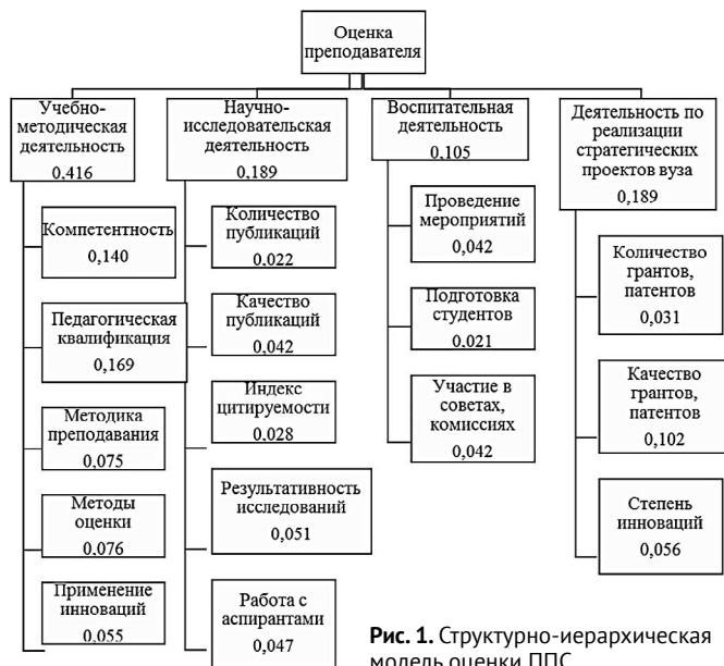
Рис. 1. Структурно-иерархическая модель оценки ППС

Представленная модель может выступать в качестве определенного «стандарта», именно с его показателями сравниваются показатели оцениваемого сотрудника.