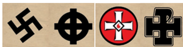
Рис. 2. Типичные образцы экстремистской символики

Среди основных инструментов воздействия на религиозное сознание молодого человека, по мнению большинства экспертов, выступает внешняя атрибутика (одежда, натальный крест, звезда Давида и др.) от ритуальных предметов до убранства церквей, мечетей. Подобная символика и атрибутика активно используется и в экстремистском сообществе, приобретая извращенные формы. В частности, крест, являясь ключевым религиозным атрибутом, находится в центре экстремистской символики – свастики, кельтского креста, герба Ку-Клукс-Клана, символа Российского национального союза (рис. 2.)