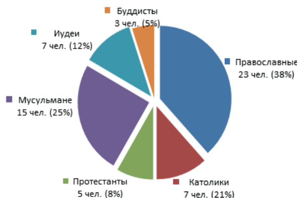
Рис. 1. Диаграмма количественного состава опрошенных экспертов, всего 60 чел.

эмпирико-эмоциональные, доктринально-повествовательные, ритуально-культовые, социально-институциональные. Показателями исследования выступали: отношение к церкви, степень религиозности, использование предшествующего опыта, интерес к духовной литературе и соблюдение моральных законов. Количественный состав опрошенных экспертов мы сформировали в виде следующей диаграммы (рис. 1).